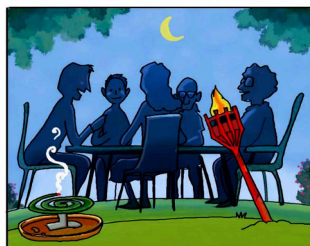
QUANDO SOGGIORNI ALL'APERTO, PROTEGGITI CON REPELLENTI AMBIENTALI. (*)

(*) Leggi attentamente le istruzioni riportate sulle confezioni.