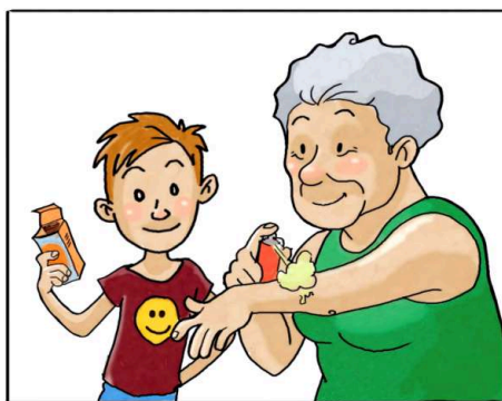
USA I REPELLENTI CUTANEI SEGUENDO LE INDICAZIONI RIPORTATE SULLE CONFEZIONI.