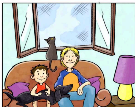
IN CASA USA LE ZANZARIERE ANZICHÉ ZAMPIRONI E FORNELLETTI.